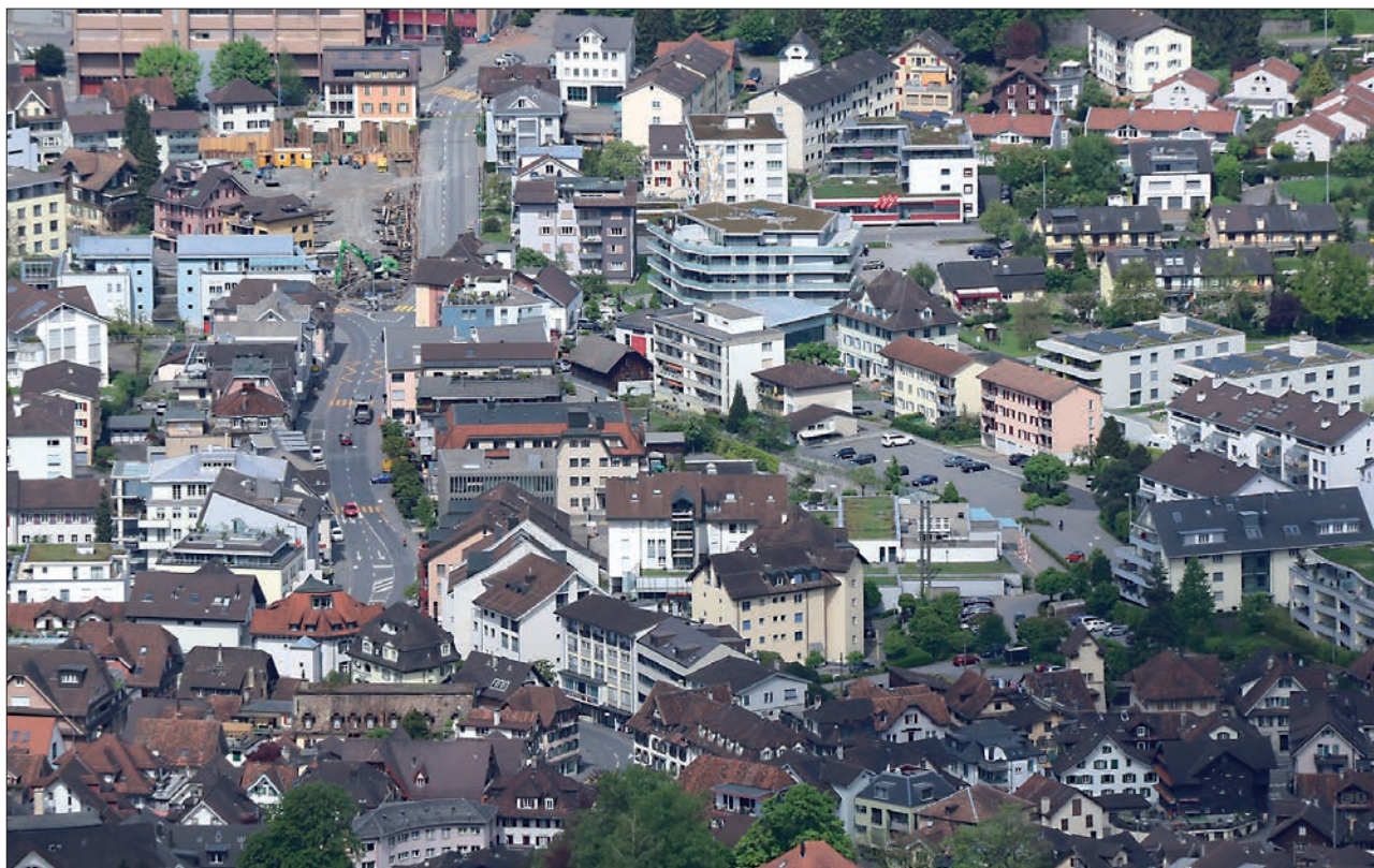
Küssnacht, schreiben SP und Unabhängige, gleiche von oben betrachtet «einer willkürlichen Siedlungsentwicklung».

Den Sozialdemokraten geht es zu schnell: Sie erinnern daran, dass die Bevölkerung des Bezirks Küssnacht zwischen 1980 und 2012 30% stärker gewachsen ist als jene der Schweiz. Überdies verfüge der Bezirk bis 2020 über genügend Wachstumsreserven, was die aktuelle Teilzonenplanrevision überflüssig mache. Heute zählt der Bezirk rund 12 500 Einwohner. Aufgrund des rechtskräftigen Zonenplans und dem gültigen Baureglement bestehen gemäss Angaben des Bezirks in bislang unüberbauten Bauzonen noch Reserven für weitere 2070 Einwohner. Dass der Bezirksrat nun mittels der Teilrevision